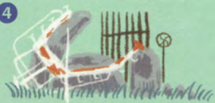
マテリナズ・カレンダー (作:小野忠弘)