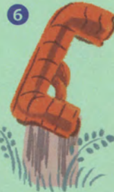
トラパース (作:清水九兵衛)