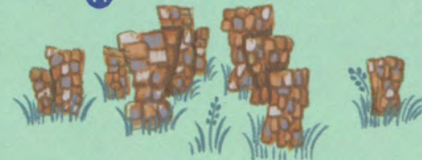
モニュメント (作:炎団乙乙)