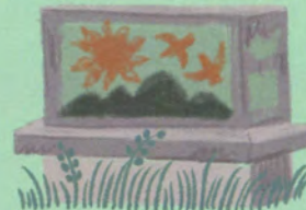
7 天地創造 (作:加藤舜陶)