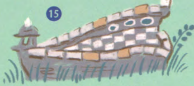
チェッカープール (作:田井重彦)