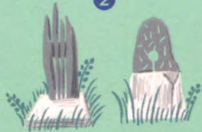
アトミックヘイスティック、 レインマウンテン (作:イサム・ノグチ)