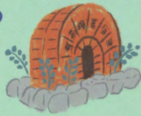
園名碑 (作:越前焼窯元グループ)