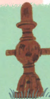
時に立つ (作:柴田正明)