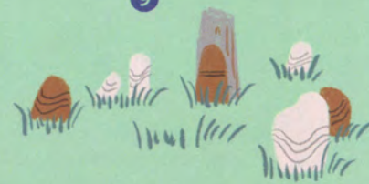
風土記 (作:市野年成)