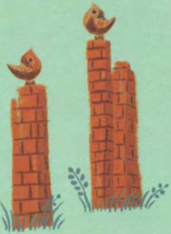
こんにちは (作:大屋光夫)