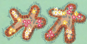
5 人生の小径 (作:ゲーリー・リーベシエ)